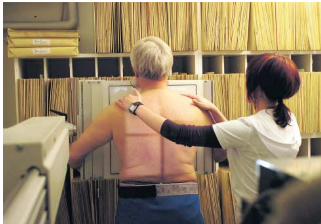
Medizin kann heute mehr, doch damit steigen auch die Kosten und mit ihnen die Prämien.

Die Unterschiede in den einzelnen Kantonen sind bei den Prämienauf-